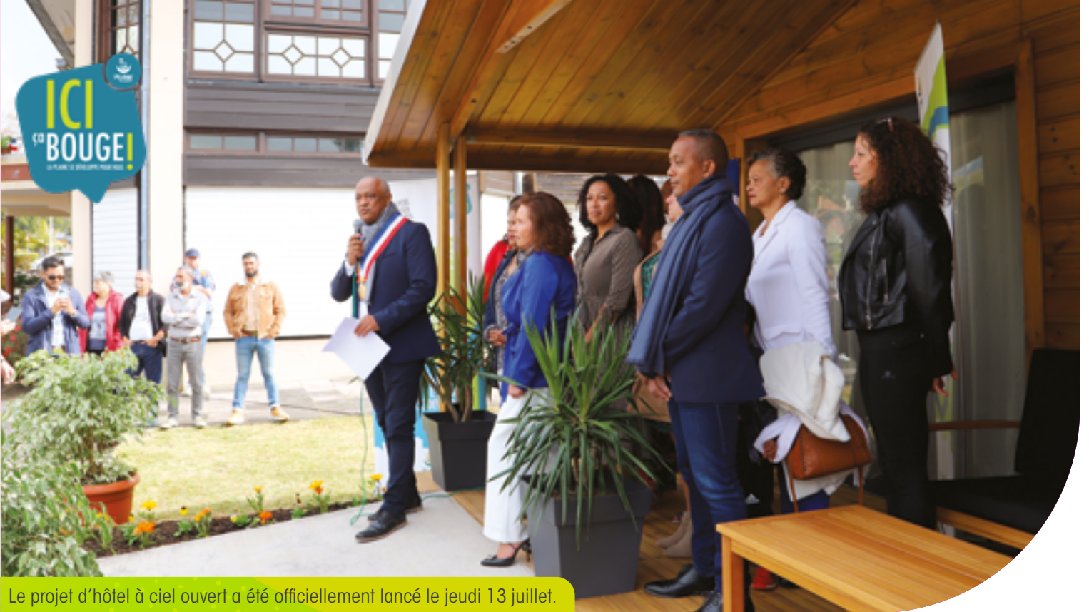
Le projet d'hôtel à ciel ouvert a été officiellement lancé le jeudi 13 juillet.