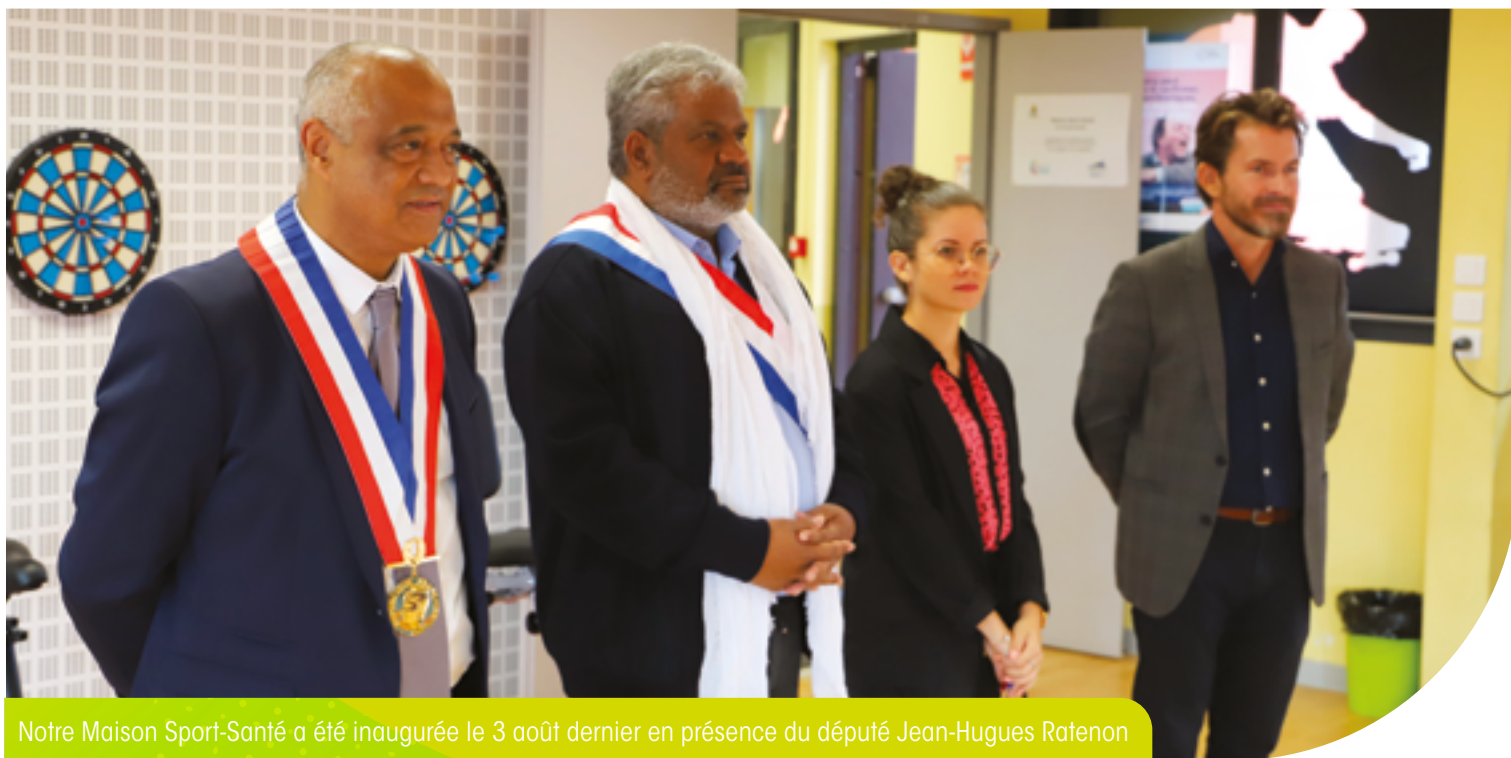
Notre Maison Sport-Santé a été inaugurée le 3 août dernier en présence du député Jean-Hugues Ratenon