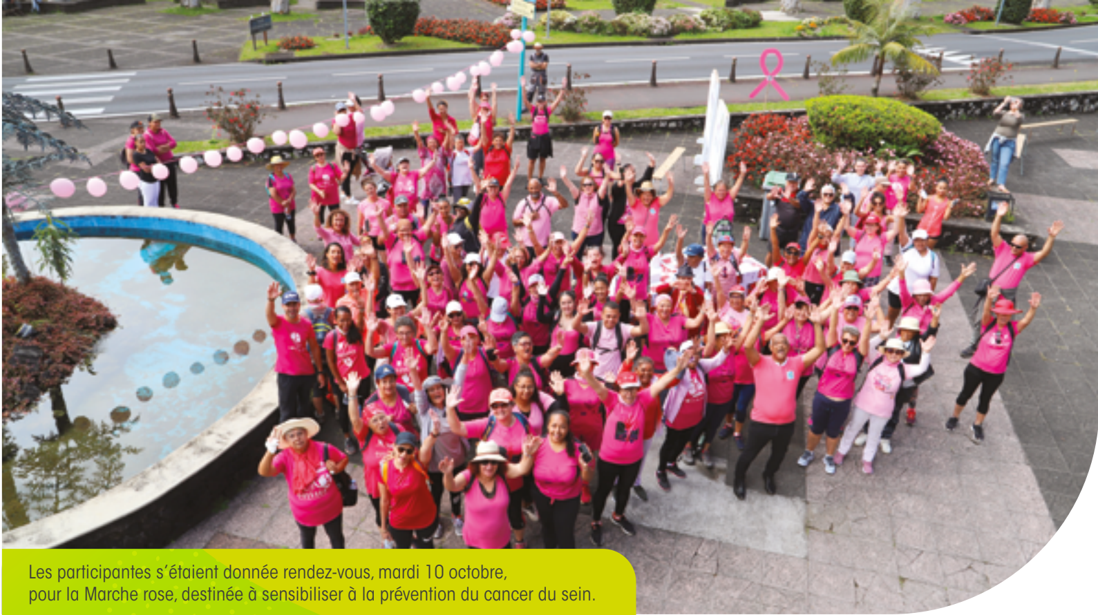
Les participantes s'étaient donné rendez-vous, mardi 10 octobre, pour la Marche rose, destinée à sensibiliser à la prévention du cancer du sein.