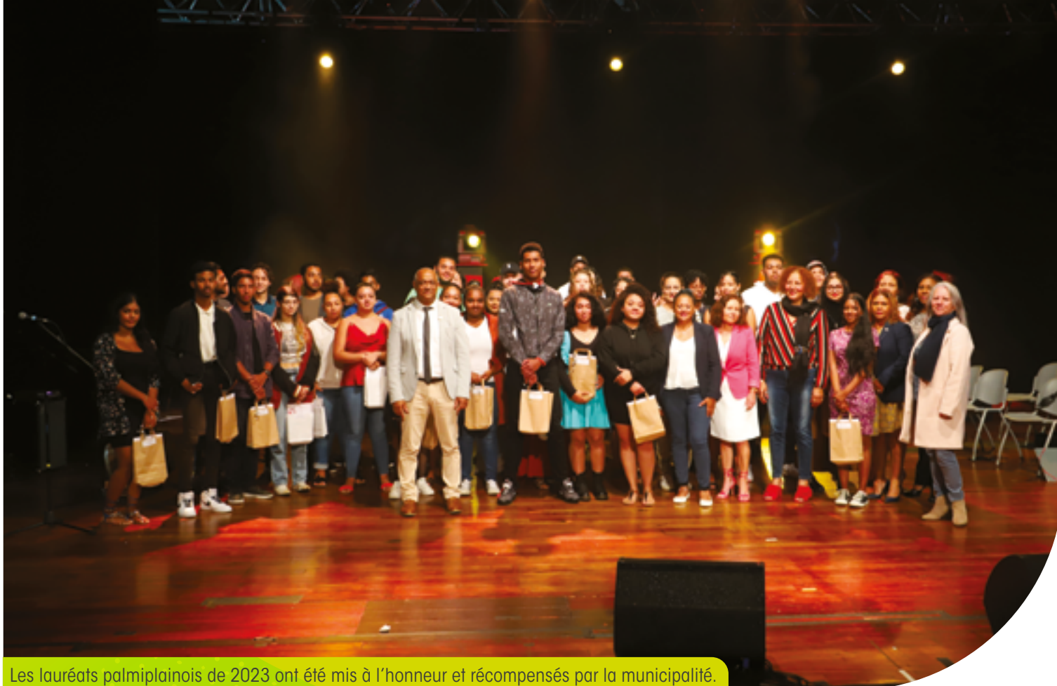
Les lauréats palmyrainois de 2023 ont été mis à l'honneur et récompensés par la municipalité.